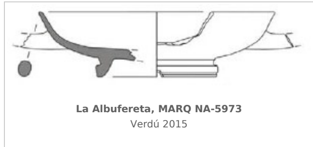
La Albufereta, MARQ NA-5973 Verdú 2015