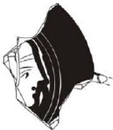
La Albufereta, MARQ NA-5973 Verdú 2015