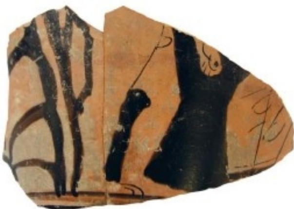
La Albufereta, MARQ NA-5975