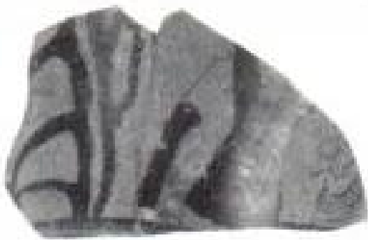
La Albufereta, MARQ NA-5975