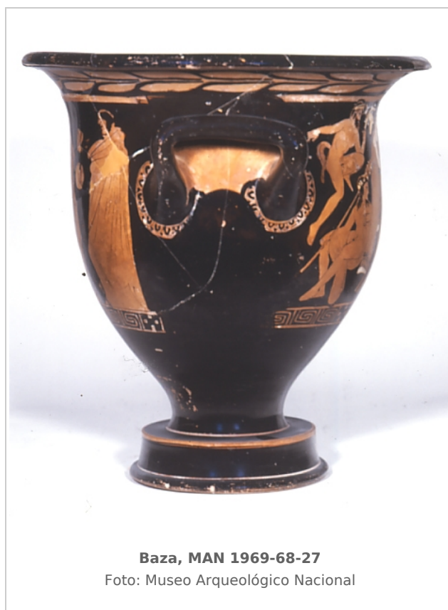
Baza, MAN 1969-68-27