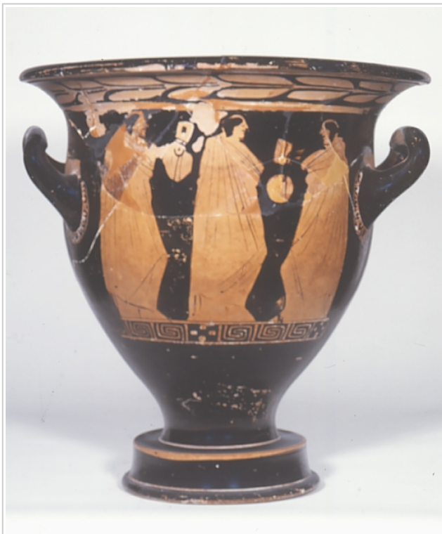
Baza, MAN 1969-68-27