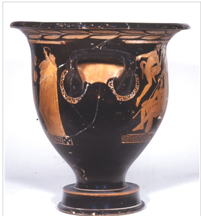
Baza, MAN 1969-68-27