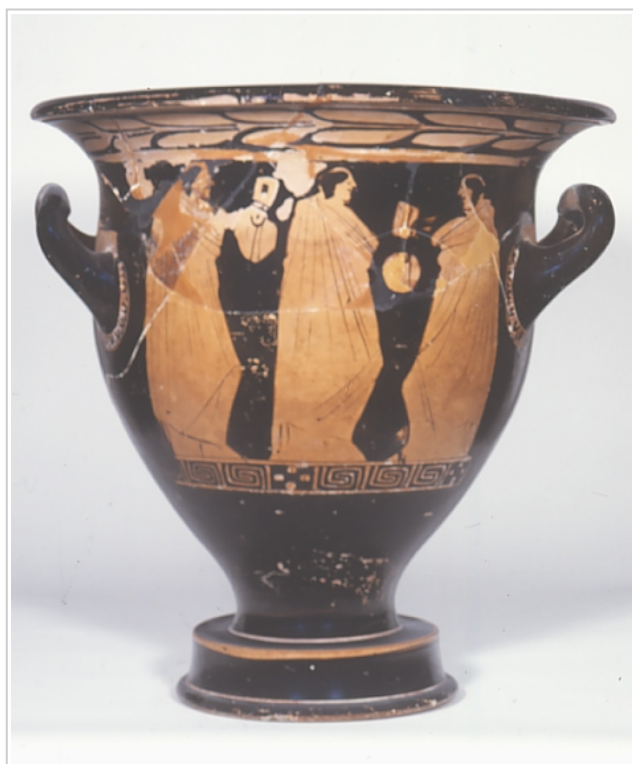
Baza, MAN 1969-68-27