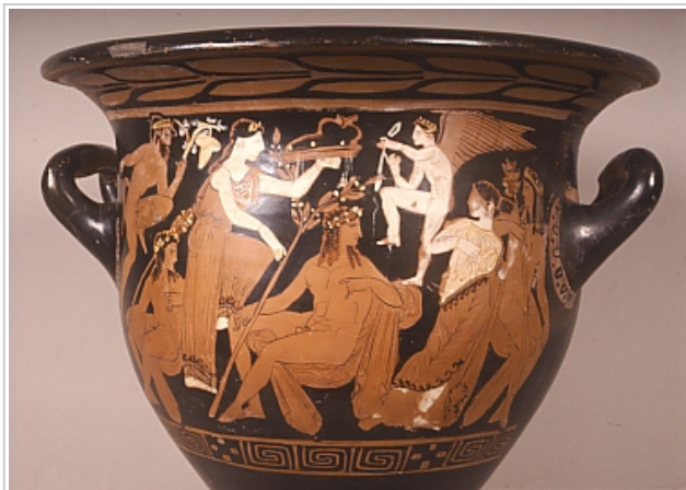
Baza, MAN 1969-68-27