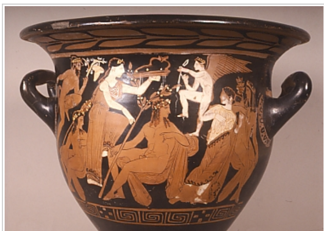
Baza, MAN 1969-68-27