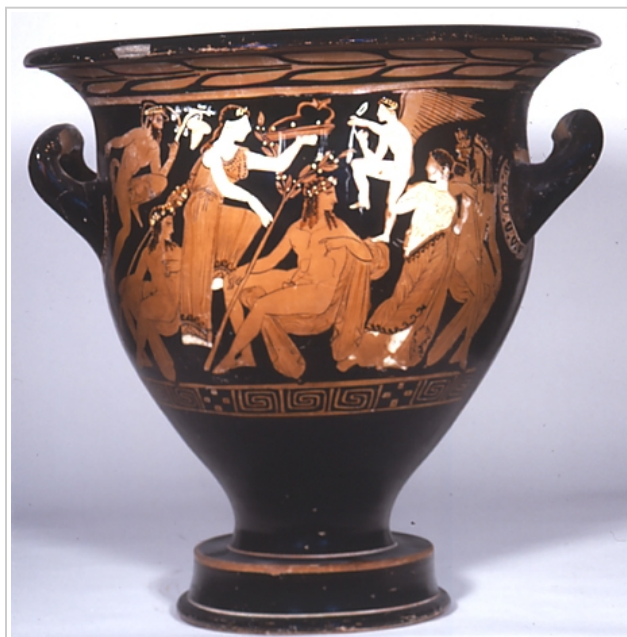
Baza, MAN 1969-68-27