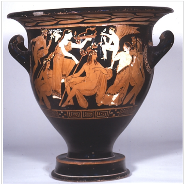
Baza, MAN 1969-68-27