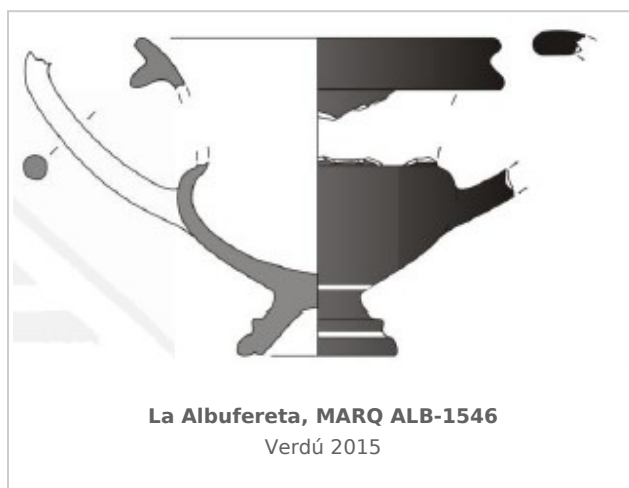
La Albufereta, MARQ ALB-1546 Verdú 2015