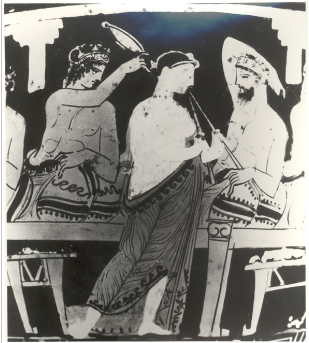
Baza, MAN 1969-68-28