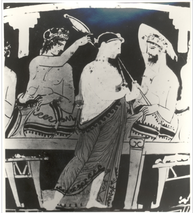
Baza, MAN 1969-68-28