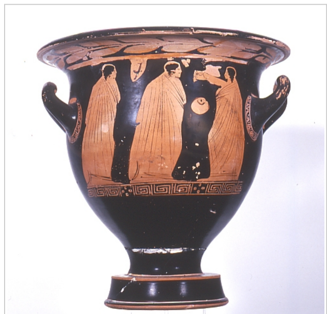
Baza, MAN 1969-68-28