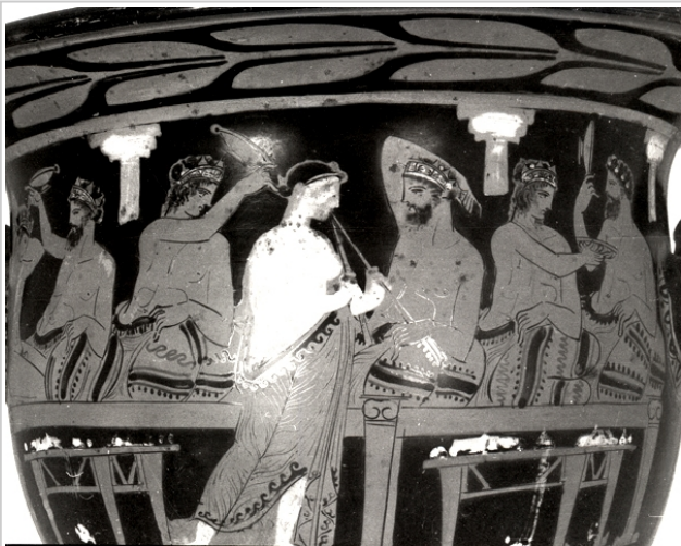
Baza, MAN 1969-68-28