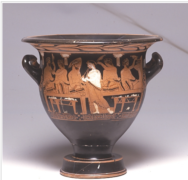
Baza, MAN 1969-68-28