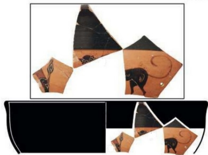
Huelva. Calle Puerto, nº 9 (Huelva) - 5011 GONZALEZ DE CANALES/LLOMPART 2023