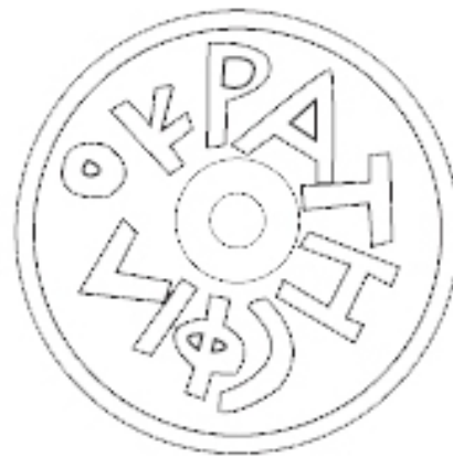
Ullastret. Puig de Sant Andreu, MAC-ULL 1465 TREMOLÉDA, SANTOS 2013