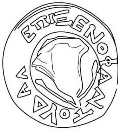
Empúries, MAC-E RG SN 131 TREMOLÉDA, J., SANTOS, M. 2013