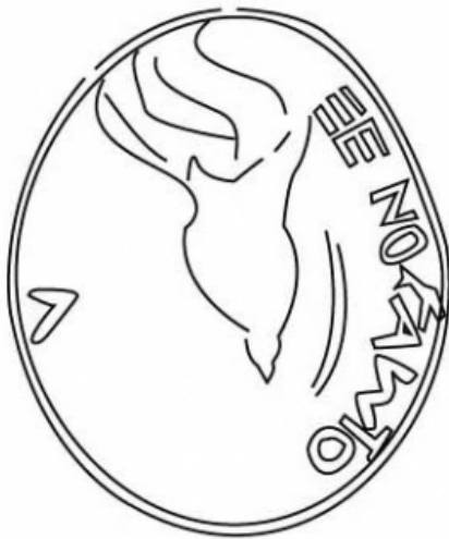
Empúries, MAC-E 11568 TREMOLEDA, J., SANTOS, M. 2013