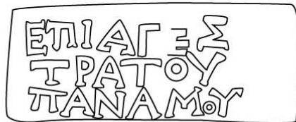
Empúries, MAC-E 1094