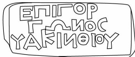
Empúries