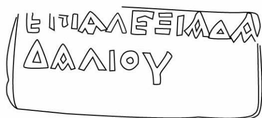
Empúries, MAC-E RG SN 132 TREMOLEDA, J., SANTOS, M. 2013