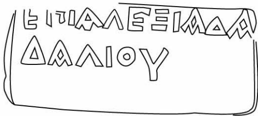
Empúries, MAC-E RG SN 132 TREMOLÉDA, J., SANTOS, M. 2013