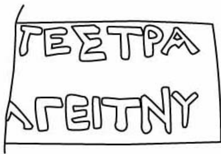
Empúries, MAC-E 11.579 TREMOLEDA, J., SANTOS, M. 2013