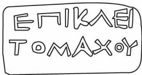
Empúries, MAC-E 11.569 TREMOLEDA, J., SANTOS, M. 2013