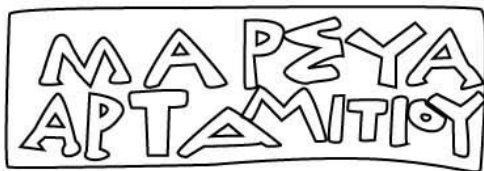
Empúries, MAC-E 1106 TREMOLEDA, J., SANTOS, M. 2013